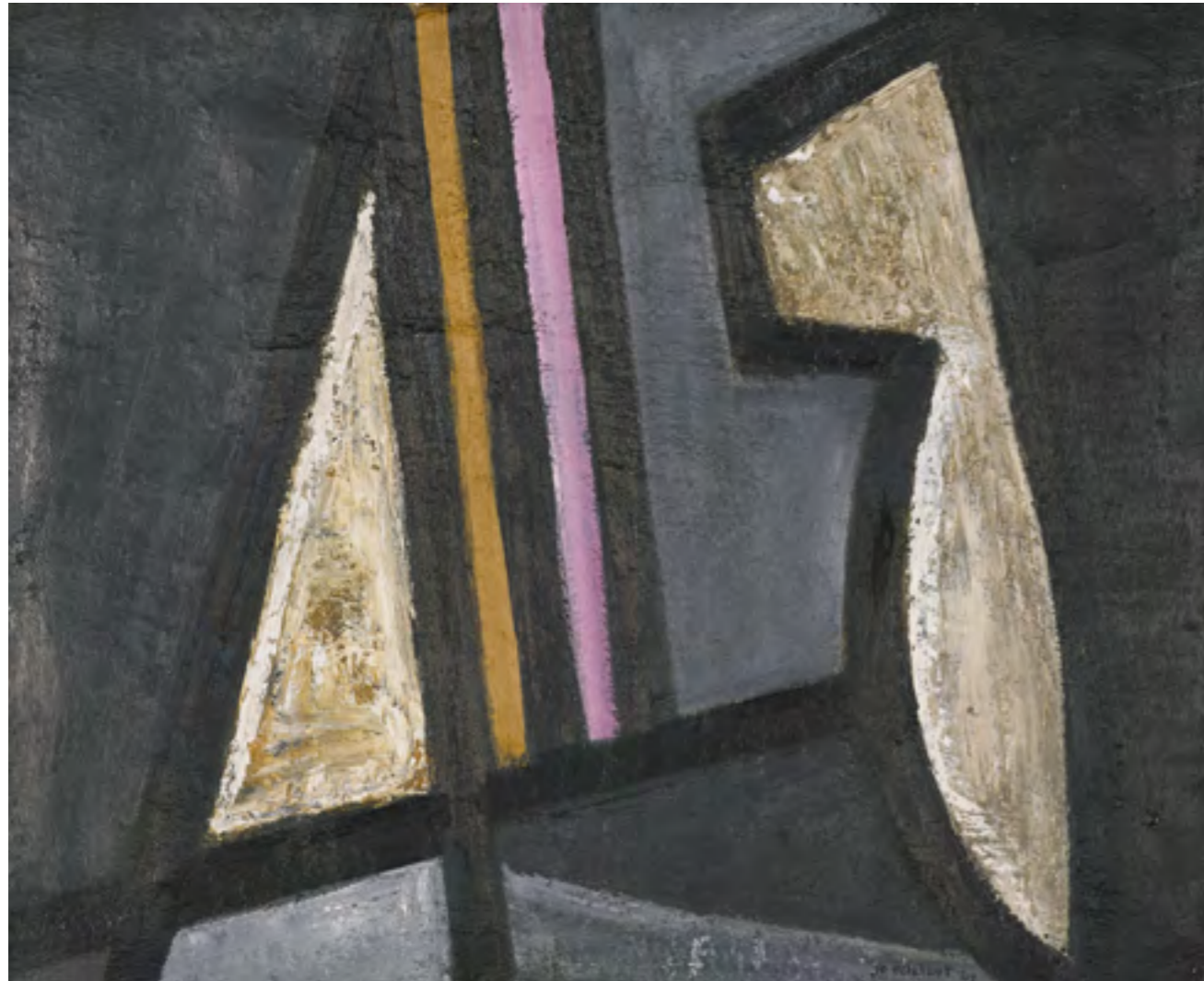
Jo DELAHAUT, Composition , 1947, Huile sur toile, 66 x 81 cm, Collection Maurice Verbaet, ADAGP 2022