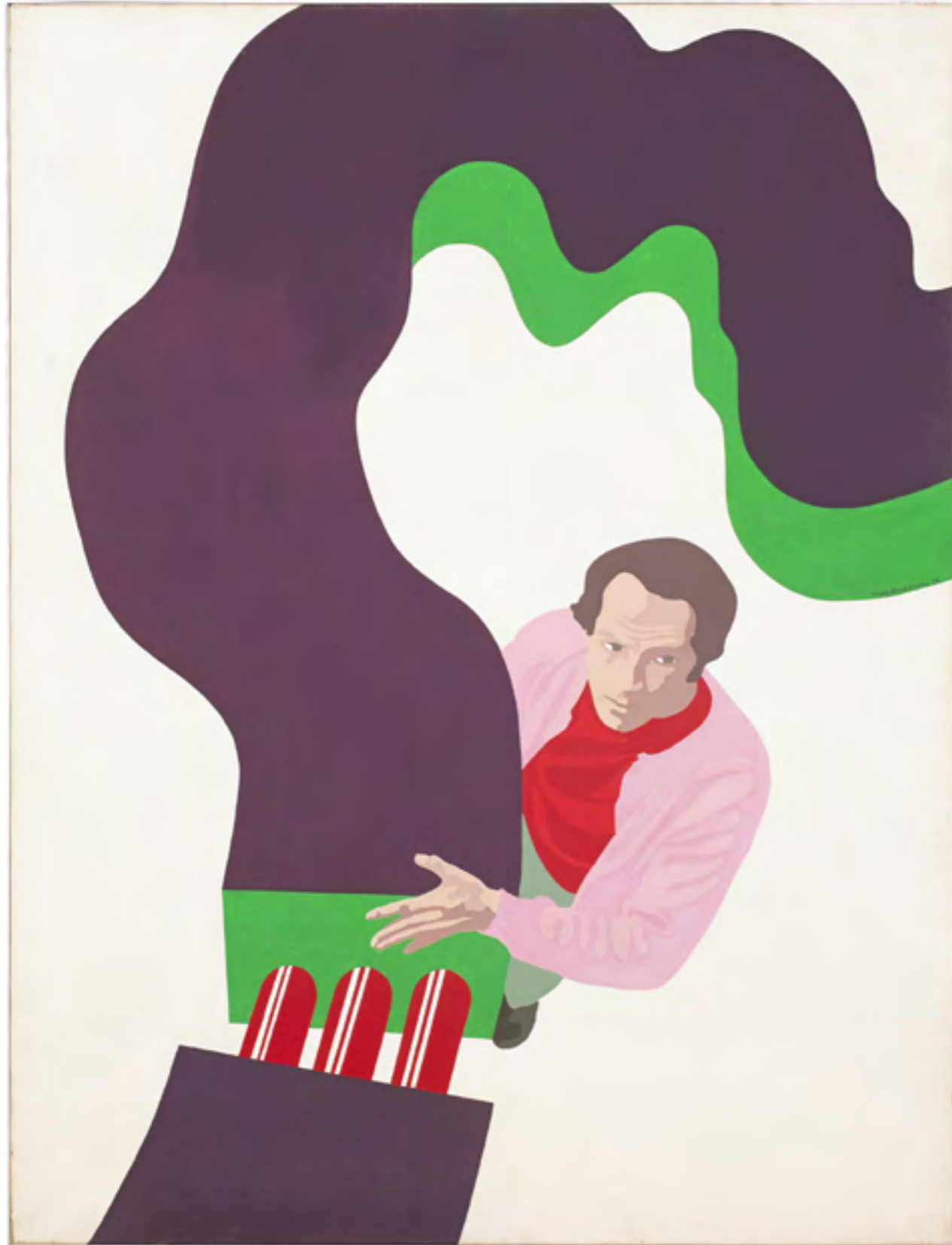
Guy BAEKELMANS, Sans titre , 1969, Huile sur toile, 131 x 97,5 cm, Collection Maurice Verbaet