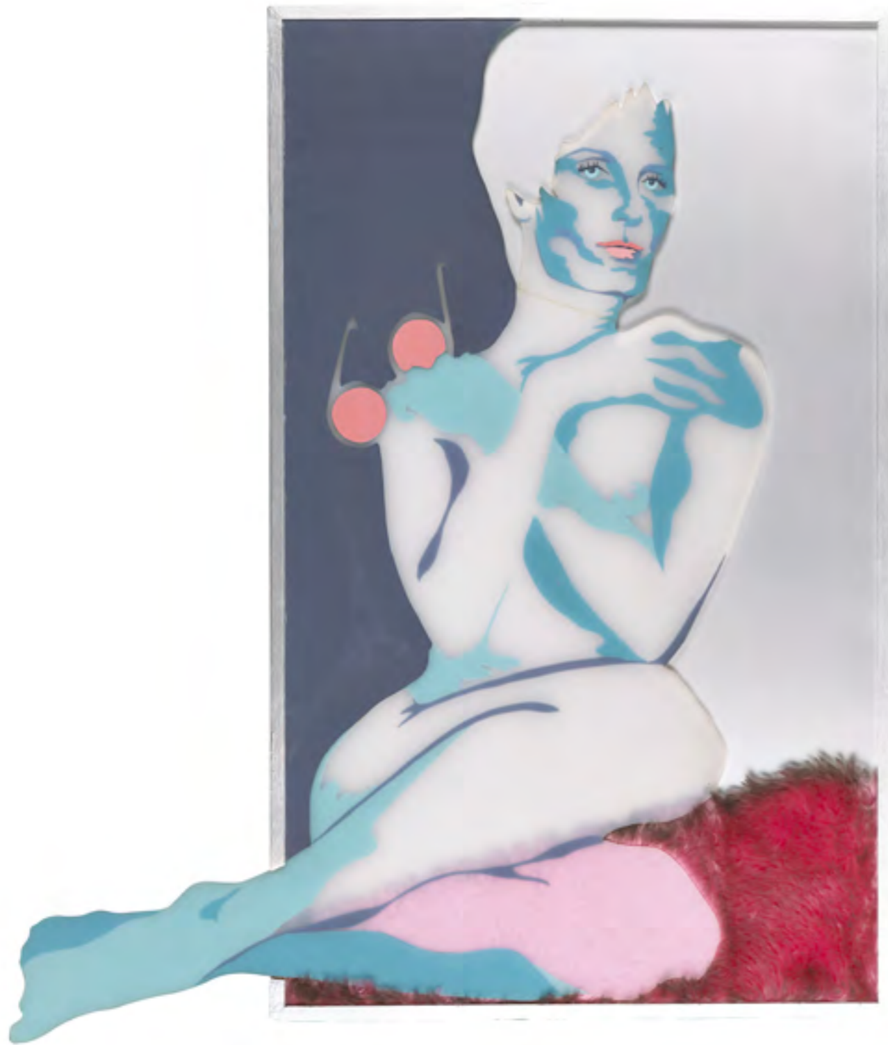
Evelyne AXELL, Portrait de la dame aux yeux bleus , 1970, fourrure, Plexiglas et émail, 106 x 66 x 3,30 cm, Collection Maurice Verbaet, ADAGP 2022