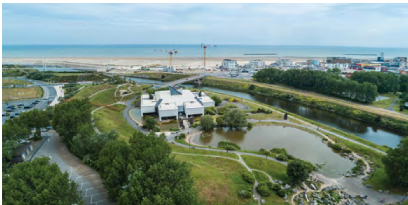
LAAC, Lieu d'Art et Action Contemporaine, Dunkerque

Avec son jardin de sculptures, d'eau, de pierres et de vent, le LAAC, Lieu d'Art et Action Contemporaine, œuvre pour la rencontre du public et de l'art, au gré d'un programme d'expositions et d'événements pensés pour tous.