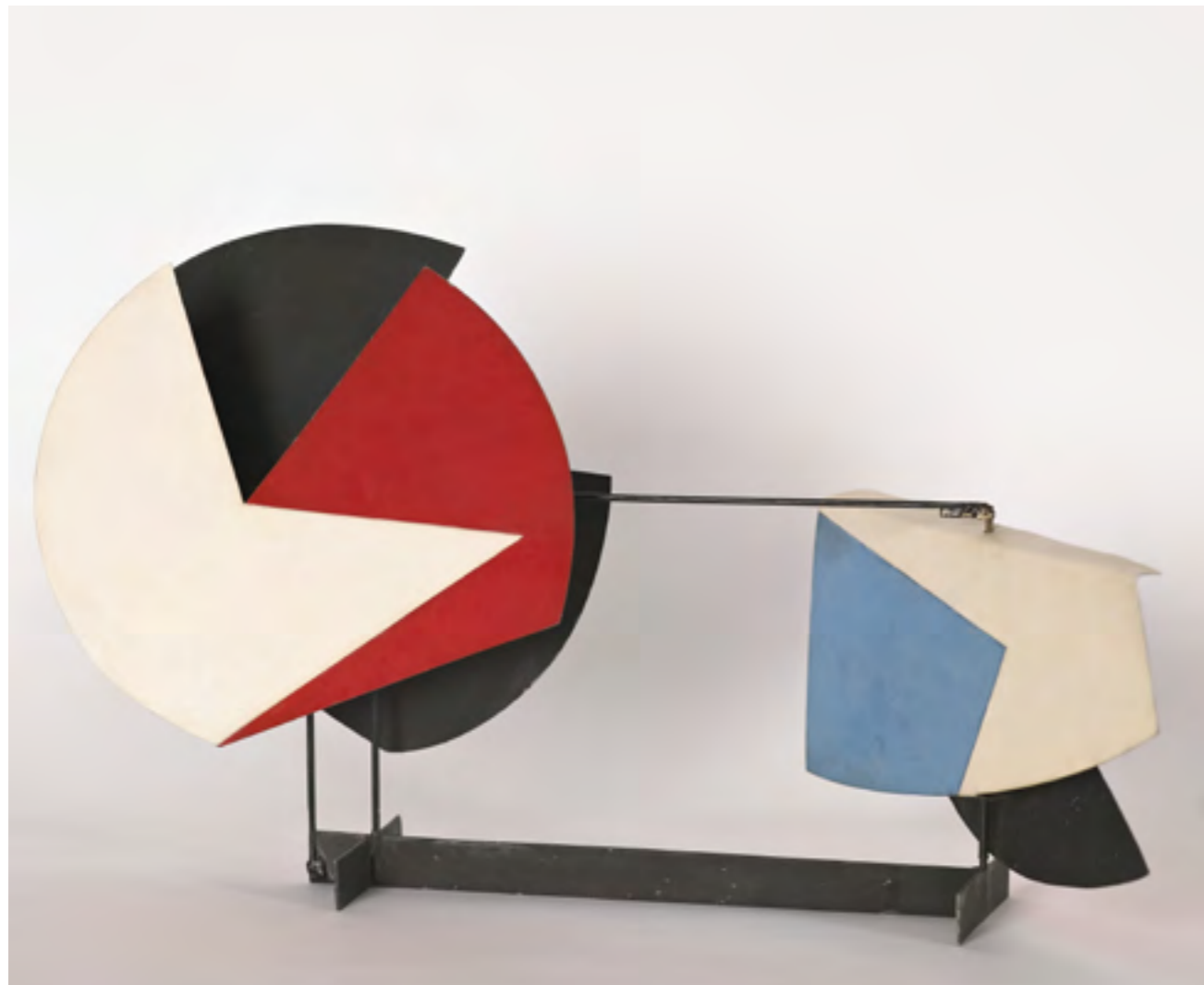
Pol BURY, Plan mobile , 1953, métal, 30 x 57 x 15 cm, Collection Maurice Verbaet, ADAGP 2022

L'accès au LAAC est soumis à la réglementation en cours sur la lutte contre le COVID-19.